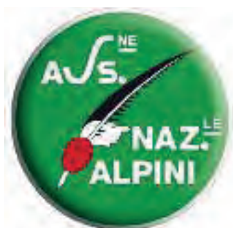
Gruppo Alpini di Quinzano d'Oglio